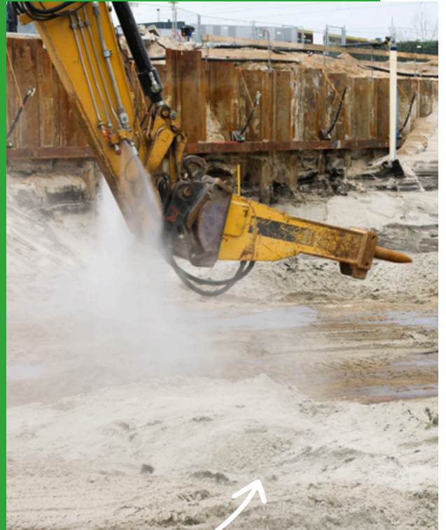
Vernevelinstallatie direct op de kraan